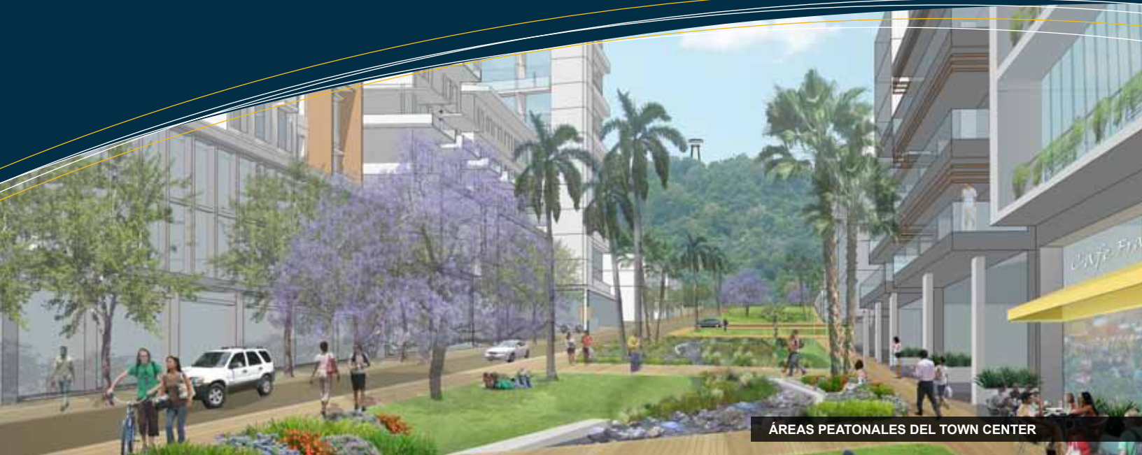
ÁREAS PEATONALES DEL TOWN CENTER