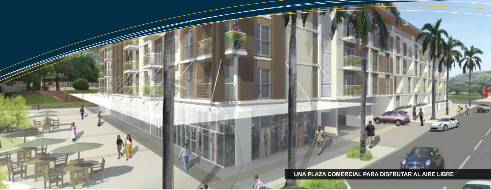
UNA PLAZA COMERCIAL PARA DISFRUTAR AL AIRE LIBRE