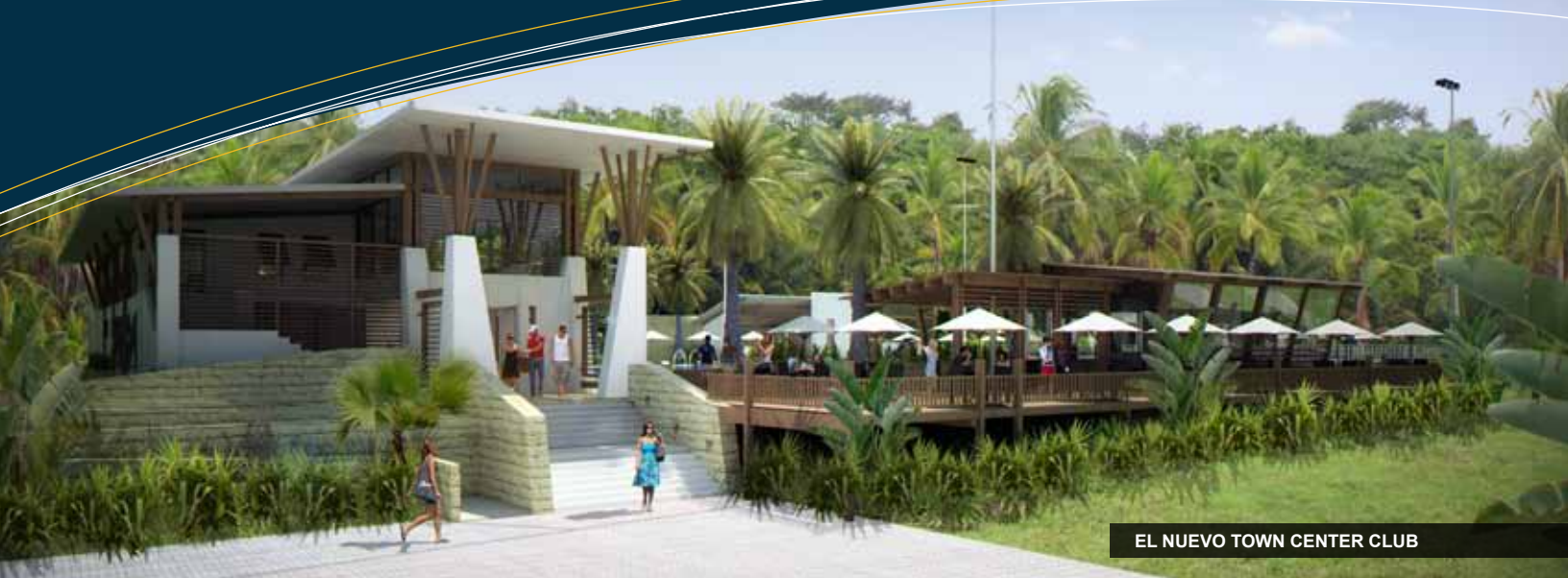
EL NUEVO TOWN CENTER CLUB