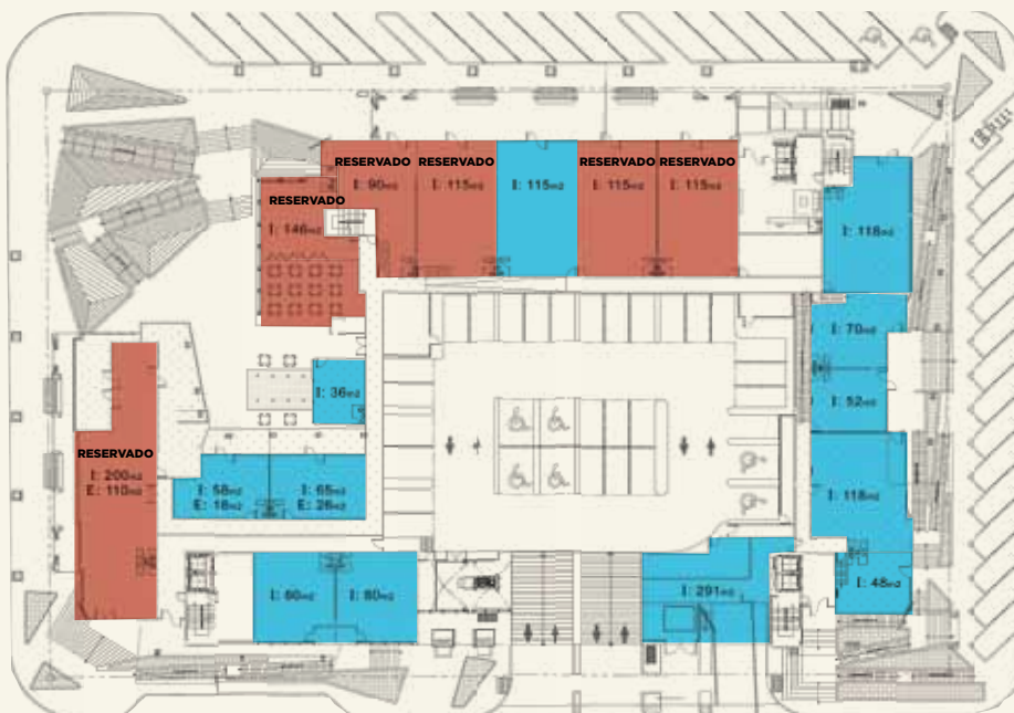
MOSAIC • PLANTA ARQUITECTÓNICA