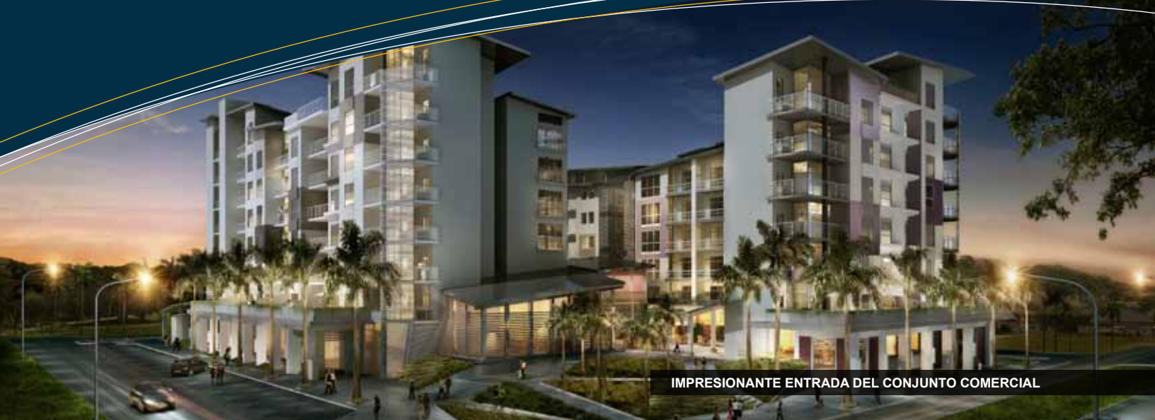
IMPRESIONANTE ENTRADA DEL CONJUNTO COMERCIAL