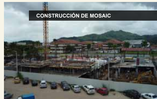
CONSTRUCCIÓN DE MOSAIC