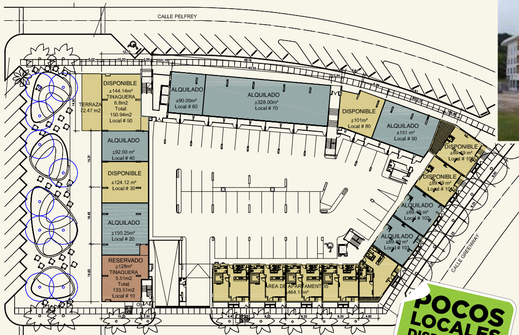
PLANTA ARQUITECTÓNICA • EDIFICIO SOLEO